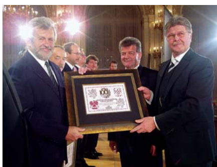
Předávání ocenění „Českých 100 nejlepších“ na pražském hradě (v letech 2000 až 2009 byla Sněžka oceněna sedmkrát)

míst Česka a Slovenska, neustále žasnou nad tím, jak krásné jsou u nás lokality, o nichž skoro nikdo neví. V nich je obrovský potenciál. Pokud by se začalo systematicky pracovat v oblasti cestovního ruchu a na nejvyšších místech se do něj pustili lidé, kteří ctí manažerská pravidla, jistě by se to našemu státu a i nám všem vyplatilo. Naše vlast disponuje řadou nádherných míst, do kterých je třeba investovat. Dát je do pořádku a hlavně dát o nich vědět, aby