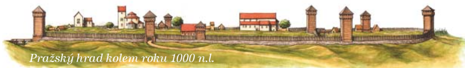
Pražský hrad kolem roku 1000 n.l.

Zábor a opevnění významné lokality osazené kostelem byl mocenský akt – symbol ovládnutí země křesťanským panovníkem. Povědomí o velkomoravských počátcích Pražského hradu přinesl až archeologický výzkum ve 20. století. Rovněž existenci kostela Panny Marie naznačovaly pouze legendy, než jej v 50. l. mezi II. a IV. nádvořím pod tzv. Tereziánským křídlem nalezl I. Borkovský.