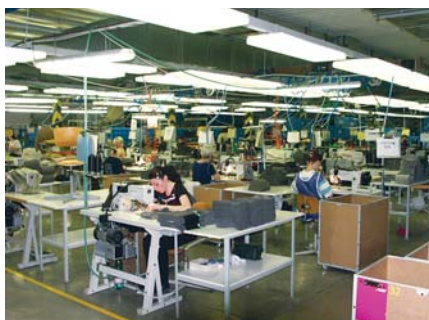
Šicí dílna dílů pro automobilový průmysl

Pokud se podívám x let dozadu, tak náš stát si nepotřeboval nic dokazovat: my ty peníze prožrali. Ale já jsem investor. Bohužel, v naší populaci je pouze pět, možná deset procent investorů. Ostatní jsou konzumenti, a ti chtějí peníze neinvestovat, a to je základní chyba. K tomu, abychom se měli lépe, se peníze nejdříve musí investovat, a teprve když vydělávají, je rozumné část z nich vyčlenit na konzumaci. Podívám-li se kolem sebe, kdekdo chce, aby mu stoupal plat, aby rostly důcho-