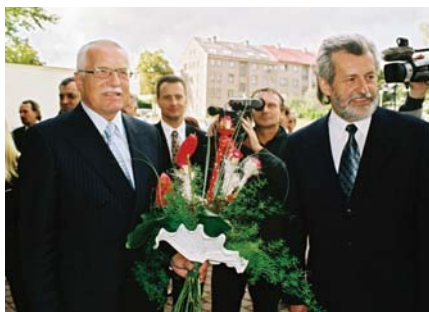
Návštěva prezidenta v družstvu Sněžka v roce 2005

Vozím v autě fotoaparát a vzhledem k tomu, že máme závody na řadě