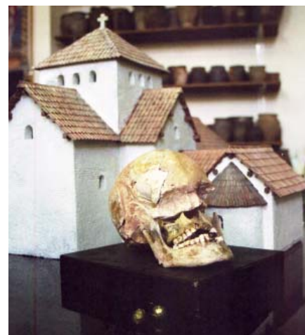
Kosterní ostatky z hrobu č.12 v Uherském Hradišti - Sadech původně kryla kaple (na obr. vpravo). Vše nasvědčuje tomu, že se jedná o hrobku krále Svatopluka I.